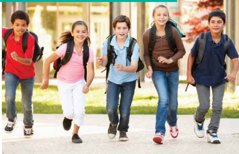
Las personas en la imagen son modelos para fines ilustrativos.

ESTAR INFORMADO ES EL PRIMER PASO PARA AYUDAR A PROTEGER CONTRA EL VPH.