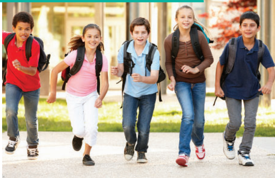
Las personas en la imagen son modelos para fines ilustrativos.

ESTAR INFORMADO ES EL PRIMER PASO PARA AYUDAR A PROTEGER CONTRA EL VPH.